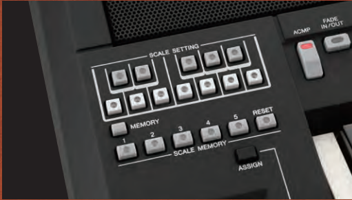
ضبط المقياس وأزرار تعيين المقياس

مع إخراج الأصوات الفائقة للأصوات الشرقية، ستحصل على الخواص الفريدة للآلة مثل التقاسيم وتريمولو وغير ذلك الكثير. حتى بدون إخراج الأصوات الفائقة، توجد ميزة جديدة "المقطوعات الأحادية" التي تتيح لك عزف الاهتزازات باستخدام عصا التحكم تمامًا مثل آلات الموسيقى الشرقية! لكل الأصوات، تدعم أزرار تعيين المقياس كل أنواع الضبط.