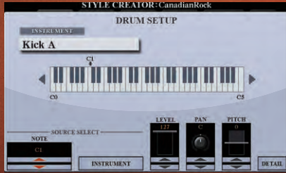
عرض إعداد الطبول

من وظيفة إنشاء الأنماط، يمكن تحرير عدة معلمات لمجموعة طبول بالتفصيل، وتستطيع دمج "الآلة" المفضلة مع عدة مجموعات طبول. استمتع بعزف الأنماط بمجموعة الطبول الفريدة لديك