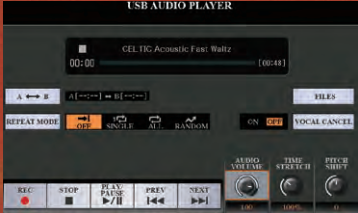
مشغل الصوت USB

إذا كنت تقوم بتحسين أداء مباشر بمقطوعات صوتية مساعدة من مكتبة الموسيقى لديك من خلال تعديل الفترة وتغيير طبقة الصوت وإلغاء الغناء، فسيضيف مشغل الصوت USB عمقاً ومرونة إلى أي حدث موسيقي. وتتيح وظيفة ربط صوت بعدة لوحات لك ربط ملفات الصوت الخاصة بك (التأثيرات الصوتية، مقطوعات غنائية، وغيرها) وتشغيلها من اللوحات أثناء الأداء.