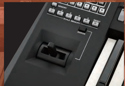
عصا التحكم بوظيفة يمكن تعيينها

ستتسقي هذه الميزة منظوراً جديداً لأدائك. امنح أدائك مذاقاً خاصاً!